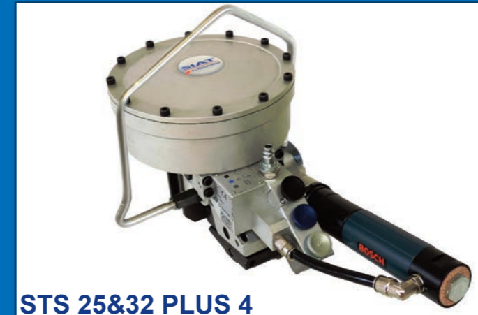
STS 25&32 PLUS 4