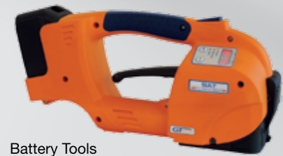
Battery Tools Reggiatrici a batteria