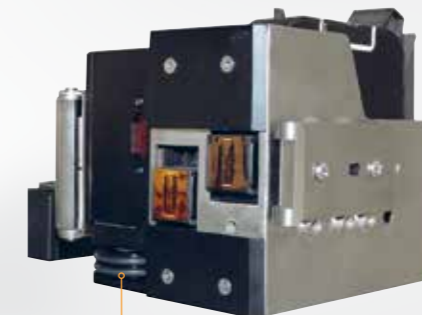
Encoder built-in the printhead for optimal quality of printing