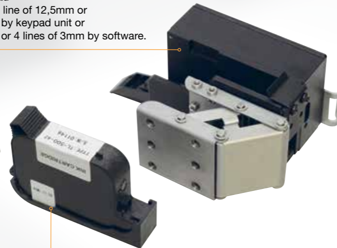
Ink cartridge with tag

K-125 Print head Max text size 1 line of 12,5mm or 2 lines of 6mm by keypad unit or 3 lines of 4mm or 4 lines of 3mm by software.