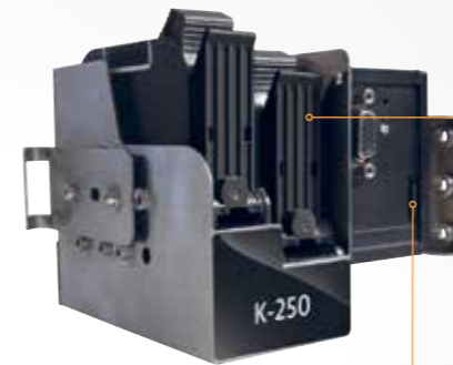
Micro SD card and USB adapter Customized software included

K-250 Print head Max text size 1 line of 25mm or 2 lines of 12mm by keypad unit or 3 lines of 8mm or 4 lines of 6mm by software.