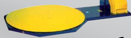
Pallet Wrappers Fasciapallet