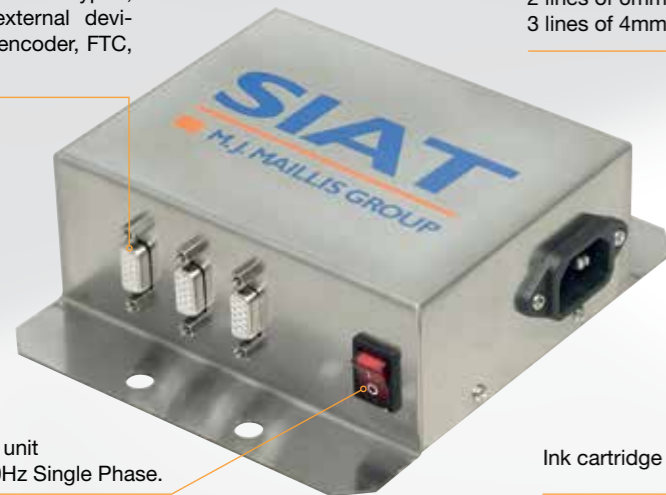
Power supply unit 220-240v - 50Hz Single Phase.

Serial ports for keypad, print head, external devices (such as encoder, FTC, alarm lamp).